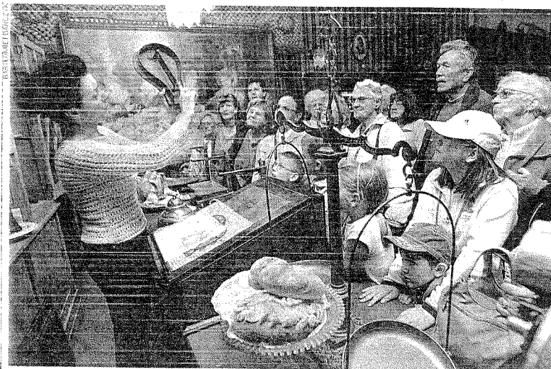
Muzeum Chleba w Radzionkowie

Szlak Zabytków Techniki to ponad 30 obiektów w województwie śląskim. To obecnie jedna z najciekawszych propozycji turystycznych w Polsce