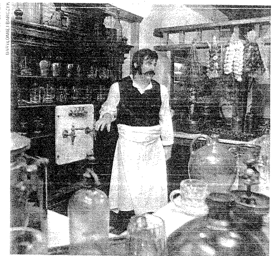
Muzeum działające przy żywieckim browarze