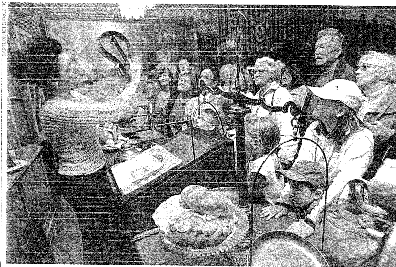
Muzeum Chleba w Radzionkowie

Szlak Zabytków Techniki to ponad 30 obiektów w województwie śląskim. To obecnie jedna z najciekawszych propozycji turystycznych w Polsce